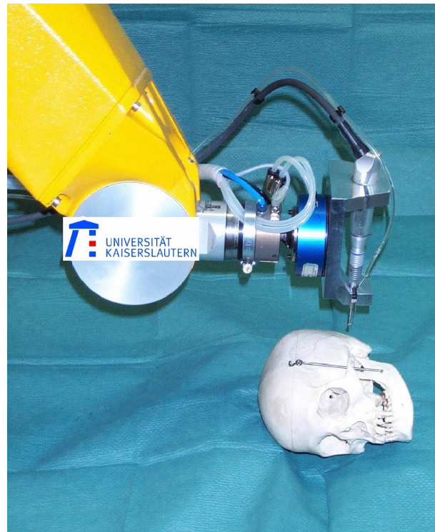
Abb. 1: Fräser nach der Kraftmessdose an einen 6-achsigen Knickarmroboter montiert.

Zusätzlich sollte festgestellt werden, ob durch Widerstandsmessungen am Fräskopf oder durch kontinuierliche Kraft/Momenten-Messung, im Sinne eines taktilen Sensors, eventuell eine Aussage über die Qualität des zu fräsenden Gewebes getroffen werden kann bzw. die Dura-Knochen-Grenze erkennbar ist.